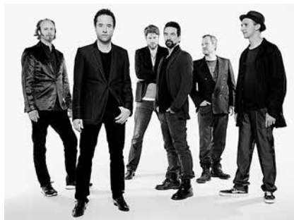
Jan Josef Liefers und seine Band Radio Doria werden das Publikum auf den großen Auftritt von Chris de Burgh einstimmen