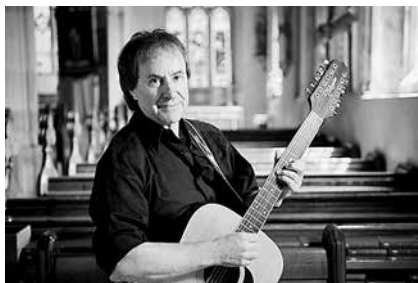
Highlight des Thüringentages in Pöbneck wird der Auftritt von Chris de Burgh am Samstagabend im Lutschgenpark sein