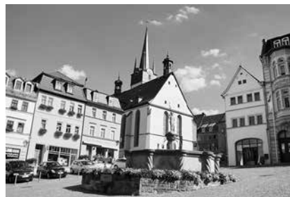
Das Pöbnecker Marktensemble mit Stadtkirche. Auf der Marktbühne wird die offizielle Eröffnungsfeier des 15. Thüringentages stattfinden.

Den Höhepunkt des Thüringentages wird der große Festumzug am 28. Juni bilden. Etwa 150 Vereine mit insgesamt circa 3 500 Teilnehmern haben sich zum Festumzug angemeldet. Das Umzugsmotto lautet: „Viele Seiten – neue Bilder“ und enthält die fünf Umzugsbilder: Weißes Gold, Samt und Seide, Schwarze Kunst, Aus einem Guss und zukunft@thueringen.de. Fuß- und Musikgruppen sowie 15 Festwagen werden sich präsentieren. Ebenso dabei sind Fahrzeuge aller Art – vom Oldtimer über Motorräder, Traktoren und Busse bis hin zu historischen Löschfahrzeugen und Lkws. Der Umzug beginnt um 14:00 Uhr an der Pöbnecker Feuerwache und führt über die B 281, den Kreisverkehr, die Bahnhofstraße, die Raniser Straße bis zur Puschkinstraße.