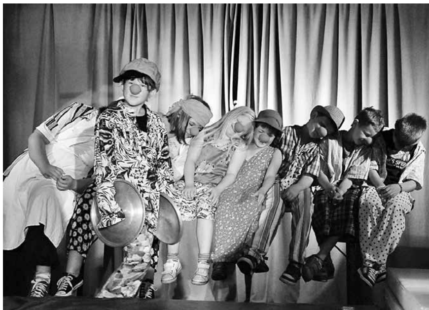
Der Kinder- und Jugendzirkus Tasifan wird die kleinen und großen Besucher des Thüringentages in ihren Bann ziehen