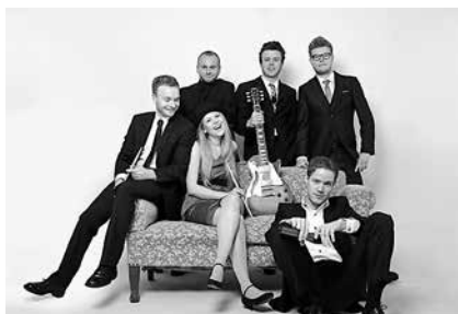
Party Musik Live gibt es von der Band Klar! im Anschluss an den großen Band-Contest am Freitagabend

Auf insgesamt 9 Bühnen präsentieren Thüringer Vereine und Verbände ein buntes Programm zum Thüringentag. Ebenso erwarten die Besucher musikalische Highlights für jeden Geschmack und jedes Alter.