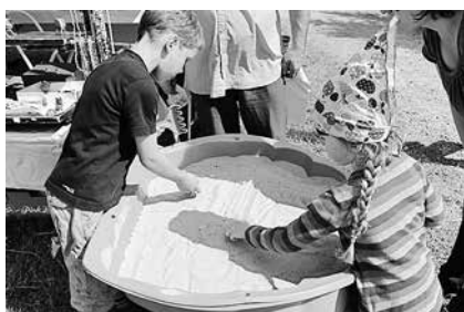
Kinder sieben Edelsteine zum Gipfeltreffen 2014

Ausgangsort: Parkplatz „Am Ritter“ Ortsgang Gehlberg Richtung Schmücke Start: 10:30 Uhr; Dauer: 1,5 Std. Länge: ca. 5 km