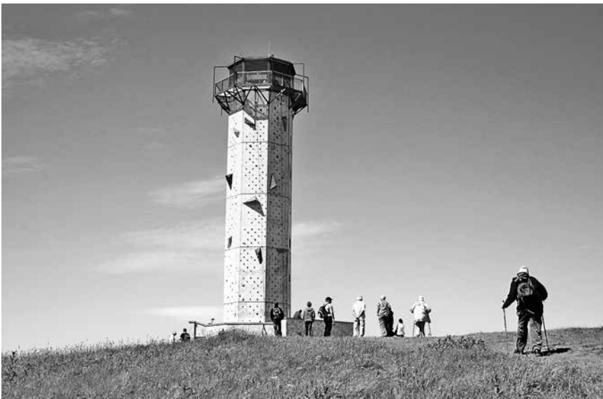
Auf dem Weg zum Schneekopfturm, mit dem einzigen 1000-m-Aussichtspunkt Thüringens