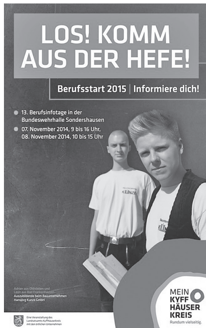
Das Plakat anlässlich der 13. Berufsinfotage im Kyffhäuserkreis

Unter der Überschrift „Nur mit dir schließt sich der Kreis“ steht schließlich die 3. Phase der Imagekampagne des Kyffhäuserkreises, die sich insbesondere an Menschen und Unternehmen, die den Landkreis erstmals oder wieder für sich entdecken, richtet. Inhaltlich gliedert sich die Kampagne in die Bereiche Arbeit, Leben und Entdecken. Der Bereich Arbeit richtet sich gleichermaßen an Unternehmer und Arbeitnehmer. Unternehmer sollen dabei den Kyffhäuserkreis als attraktiven Wirtschaftsstandort entdecken, der durch eine leistungsfähige Infrastruktur, verfügbare Flächen zur Ansiedlung bzw. Erweiterung von Unternehmen sowie durch eine unbürokratische Unterstützung von Investitionsabsichten durch die öffentliche Verwaltung zu überzeugen weiß. Da inzwischen auch in Nordthüringen ein wachsender Fachkräftebedarf zu verzeichnen ist, dient die Kampagne auch deren Gewinnung. Hierzu werden auch gezielt die Möglichkeiten der Agentur für Arbeit sowie der Thüringer Agentur für Fachkräftegewinnung genutzt. Willkommen sind ausdrücklich auch ausländische Arbeitnehmer.