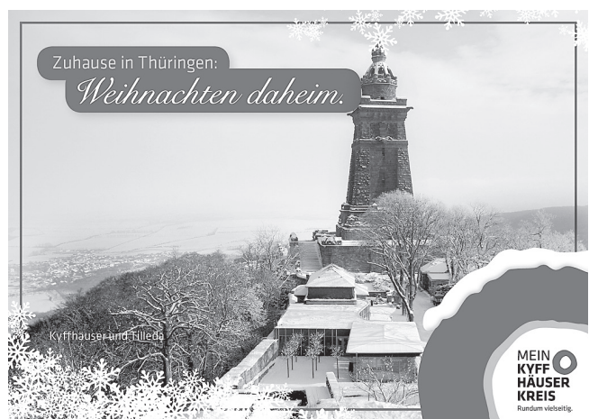
Das Kyffhäuser-Denkmal im Winter