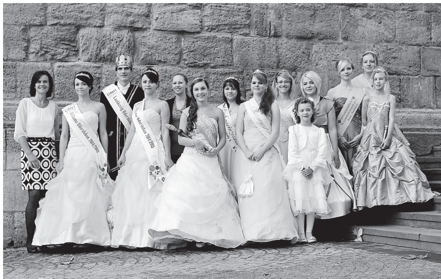
Die Berufung der Botschafter für die Imagekampagne