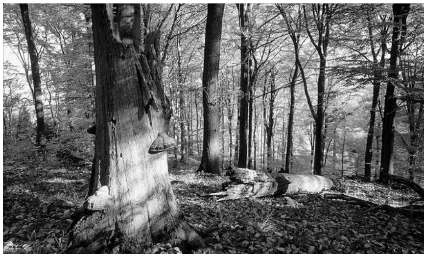
Im Rahmen des Naturschutzgroßprojekts „Hohe Schrecke - Alter Wald mit Zukunft“ werden urwaldartige Buchenmischwaldbestände über ein Wander- und Radwegenetz touristisch erschlossen

An vier Info-Theken erhält der Messebesucher dann weiter gehende Informationen über den Landkreis Sömmerda, sei es zu dem gut ausgebauten Radwegenetz, zu Burgen und Schlössern, dem Naturschutzgroßprojekt