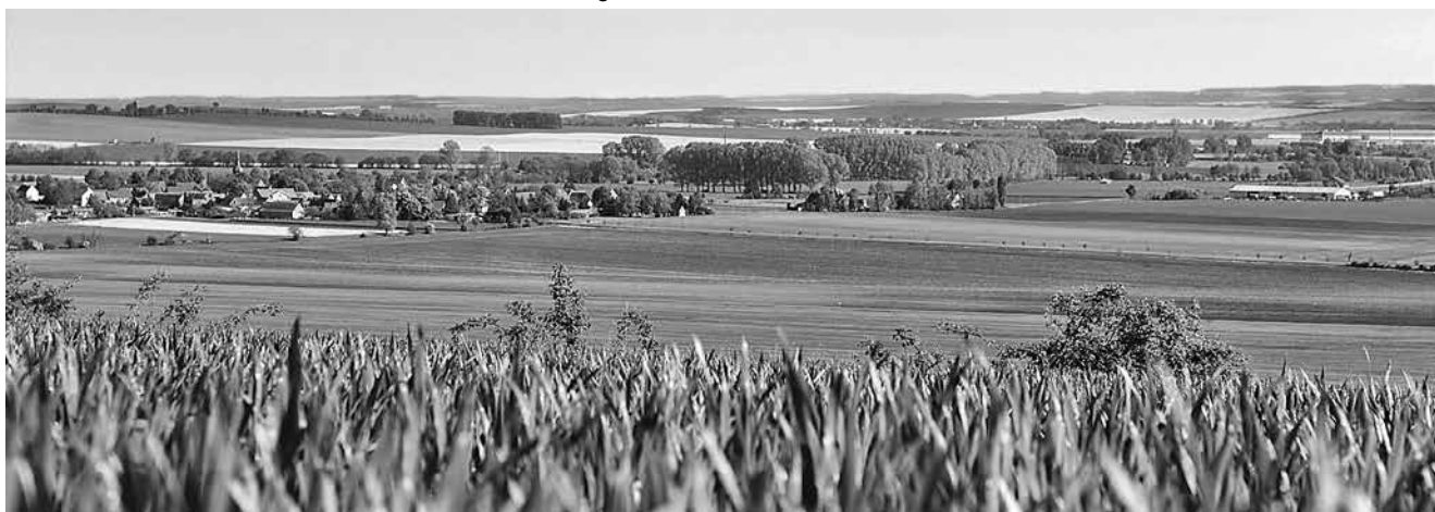
Die Thüringer Ackerebene ist gekennzeichnet durch kleine, beschauliche Ortschaften und die Weite der Feldfluren einer modernen Landwirtschaft

Für Interessenten aus der Region organisiert die Verwaltungsgesellschaft des ÖPNV Sömmerda gemeinsam mit dem Regionalen Tourismusverbund Sömmerda e. V. Busreisen nach Berlin. Termine und Fahrpreise finden Sie unter: www.linienverkehr.de .