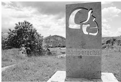
Der Ausstellungskomplex „Steinrinne“ Bilzingsleben