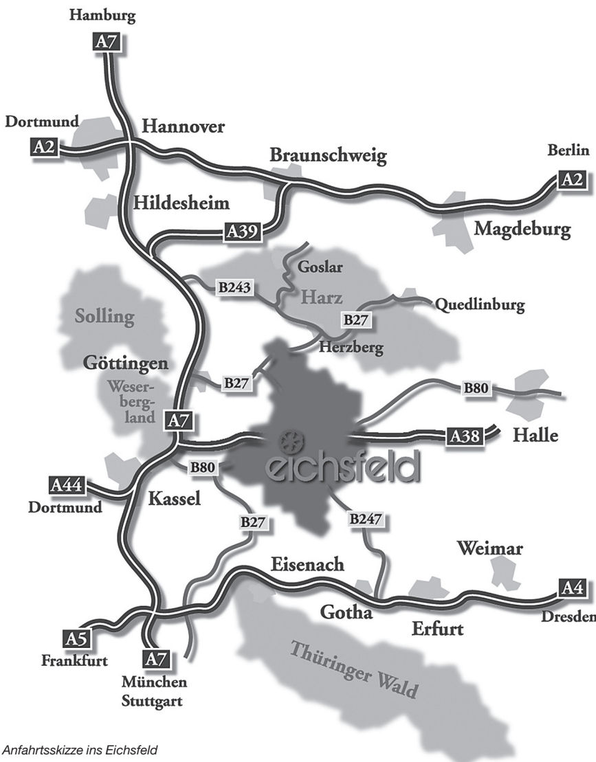
Anfahrtsskizze ins Eichsfeld