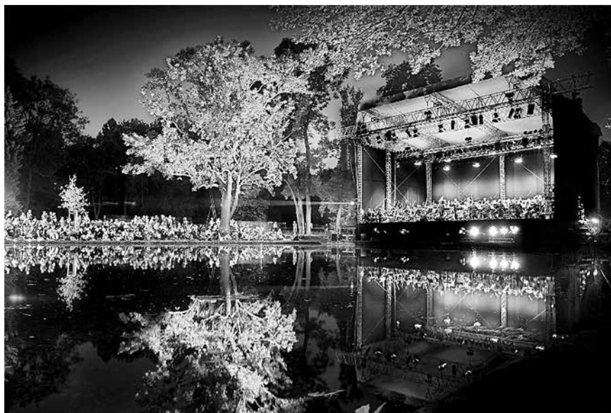
Konzernächte auf der Seebühne: Die Staatskapelle Weimar (12. Juli) und Roger Cicero (19. Juli) treten auf