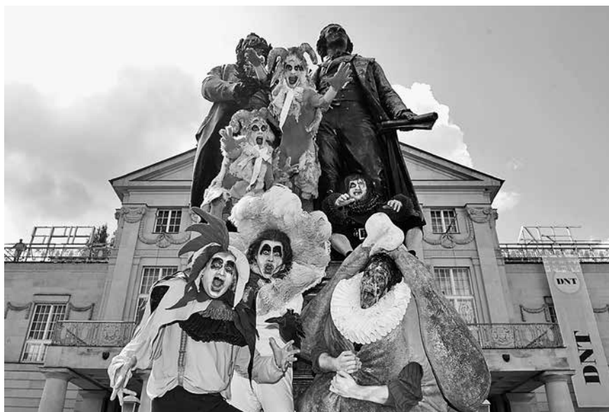
Sommertheater: Goethes „Reineke Fuchs“ vier Wochen lang auf dem Theaterplatz