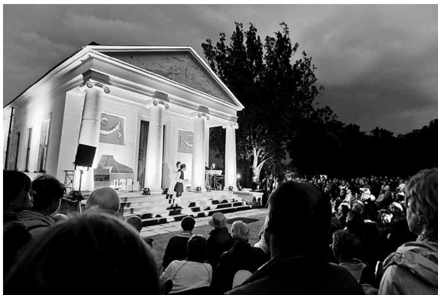
Fest zu Goethes Geburtstag am Römischen Haus