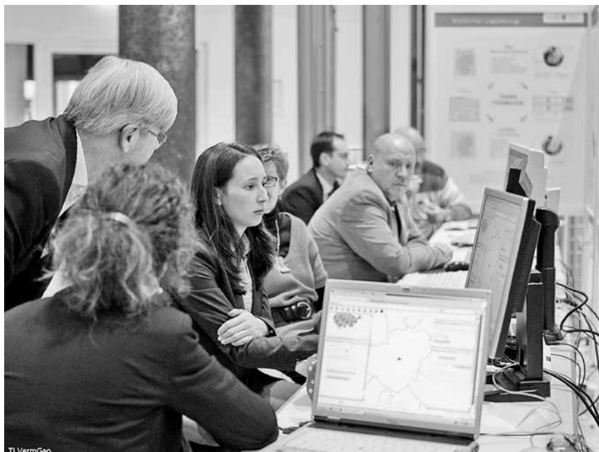
Behördenpräsentation zum 8. Thüringer GIS-Forum