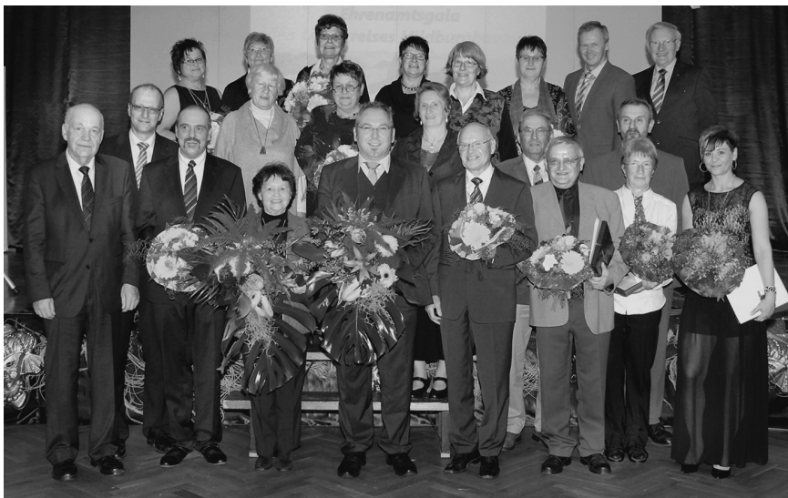
Alle Geehrten der Ehrenamtsgala