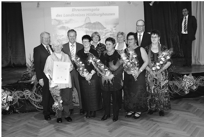
Thüringer Ehrenamtszertifikat an den Hospizverein Emmaus e. V. Hildburghausen

Die diesjährige Teamauszeichnung erhielt der Hospizverein Emmaus e. V. Hildburg-