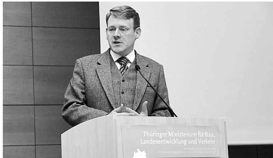
Bauminister Christian Carius