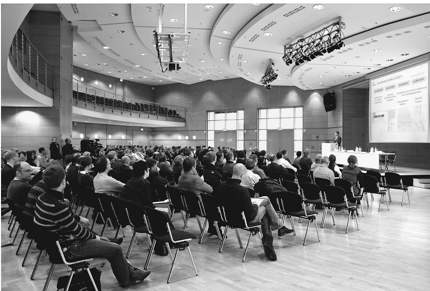
Auftaktveranstaltung des 7. Thüringer GIS-Forums