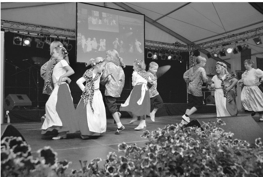
Kindertanzgruppe „Nathetaler“ aus Neuendorf