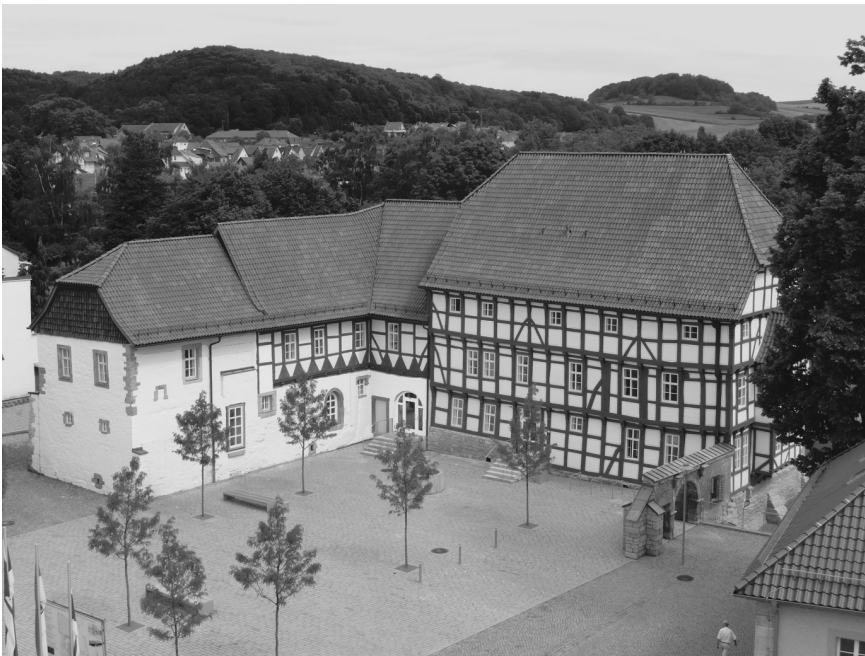
Rathaus Altes Rentamt, Worbis