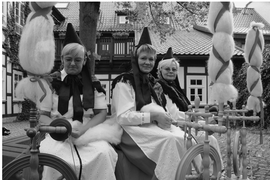
Haus Gülden Creutz mit Frauen der Frauenwerkstatt

Umzug, um 14:00 Uhr wird er an vielen Gästen des Eichsfeldes durch Worbis ziehen. Nach dem Umzug treffen sich alle zum großen Fest der Begegnung auf dem Klostergelände, wo mit dem historischen Markt und der Gruppe „Wilderer“ das Fest noch längst nicht zu Ende ist.