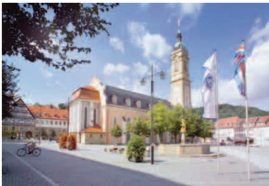
Markt mit Georgenkirche