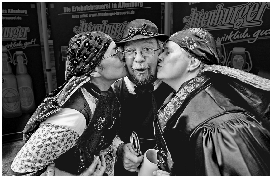
Die Mitglieder des Altenburger Folklorensembles warten zum Trachtenfest mit einem stimmungsvollen Programm auf

Brauerei mit Brauereimuseum und die Altenburger Destillerie & Liqueurfabrik mit Museum – auf die Gäste. Und neben den ständigen Ausstellungen in den Museen wird es zudem Sonderausstellungen zum Trachtenfest auf dem Residenzschloss, im Lichthof des Landratsamtes und in der Galerie des Kulturbundes geben.