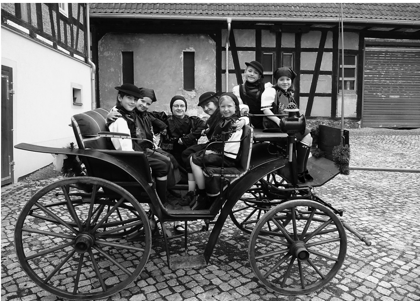
De Altenborger Kengerschar