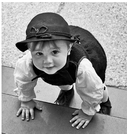
Kind in Altenburger Tracht

nach Altenburg werden wohl die Trachtengruppen von der Insel Föhr, aus Lettland und aus der Slowakei haben“, schätzt Stefan Müller ein. Für die große Trachtenparade am Festsonntag werden sogar mehr als 2 700 Teilnehmer erwartet, berichtet Müller weiter, der zudem mit bis zu 30 000 Besuchern, vorrangig aus Mitteldeutschland, rechnet. Und die können sich auf ein vielfältiges Programm freuen: