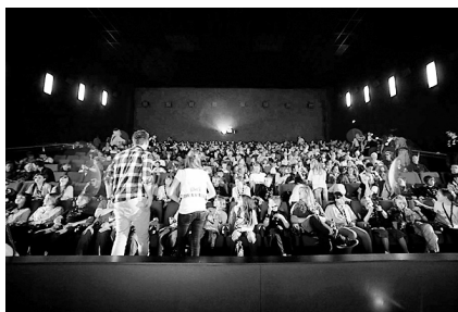
Erwartungsvolle Filmfans

im Alter von 10 bis 12 Jahren die GOLDENEN ONLINE SPATZEN in den Kategorien Webseite, TV-Webseite und Onlinespiel.