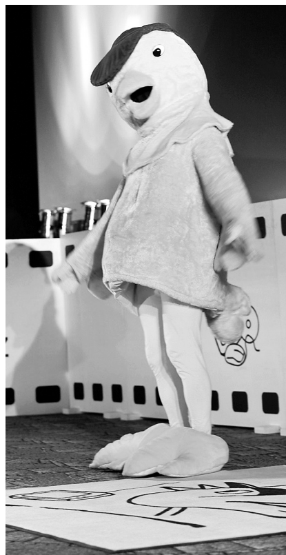
Der GOLDENE SPATZ freut sich auf die Besucher 2012!

Veranstalter des Festivals ist die Deutsche Kindermedienstiftung GOLDENER SPATZ, in der MDR, ZDF, RTL, die Thüringer Landesmedienanstalt, die Mitteldeutsche Medienförderung, die Stadt Gera und die Landeshauptstadt Erfurt zusammenarbeiten.