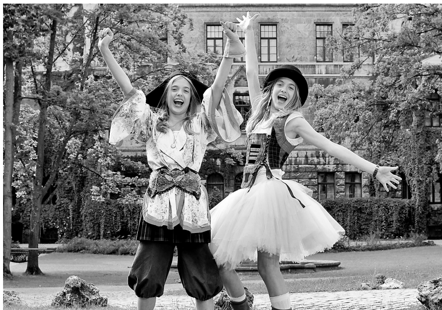
Die Festivalpremiere von Hanni & Nanni 2 ist der Auftakt des 20. Festivals GOLDENER SPATZ

Gisela Husemann Verlag e. Kfr. Wartburgstraße 6, 99817 Eisenach PVSt, Deutsche Post AG, Entgelt bezahlt F 11297