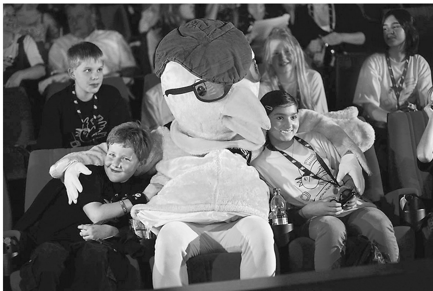
GOLDENER SPATZ mit Jurykindern zum Auftakt des Festivals 2011 in 3D