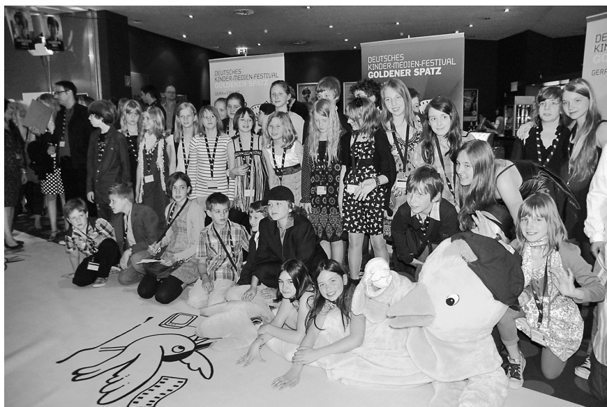
Großer Fotocall mit den Jurys auf dem goldenen Teppich vor der Preisverleihung 2011