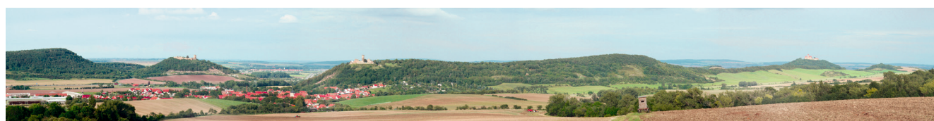
Panorama Drei Gleichen