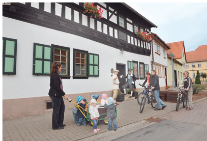
Bachradweg – Bachstammhaus Wechmar

Radweg den Truppenübungsplatz Ohrdruf, dessen Grenzen durch Warnschilder und Schranken kenntlich gemacht sind.