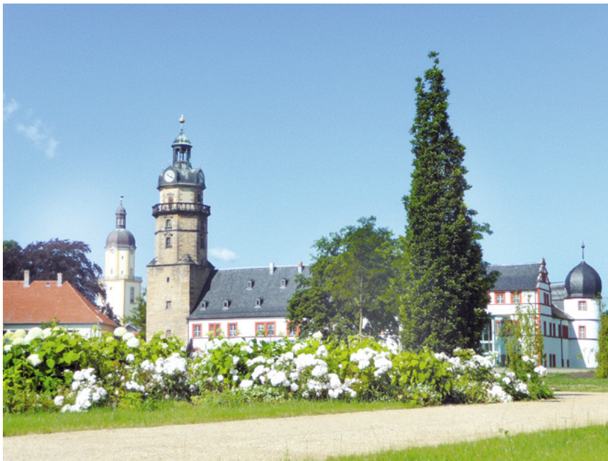
Bachradweg – Schloss Ehrenstein Ohrdruf

Die Bach-Route ist ein Radrundweg mit zwei Abzweigen, von denen einer an den Landgrafenburgen Burg Gleichen und Mühlburg vorbeiführt. Ein zweiter verbindet Arnstadt mit Dornheim. Auf seiner gesamten Länge umrundet der