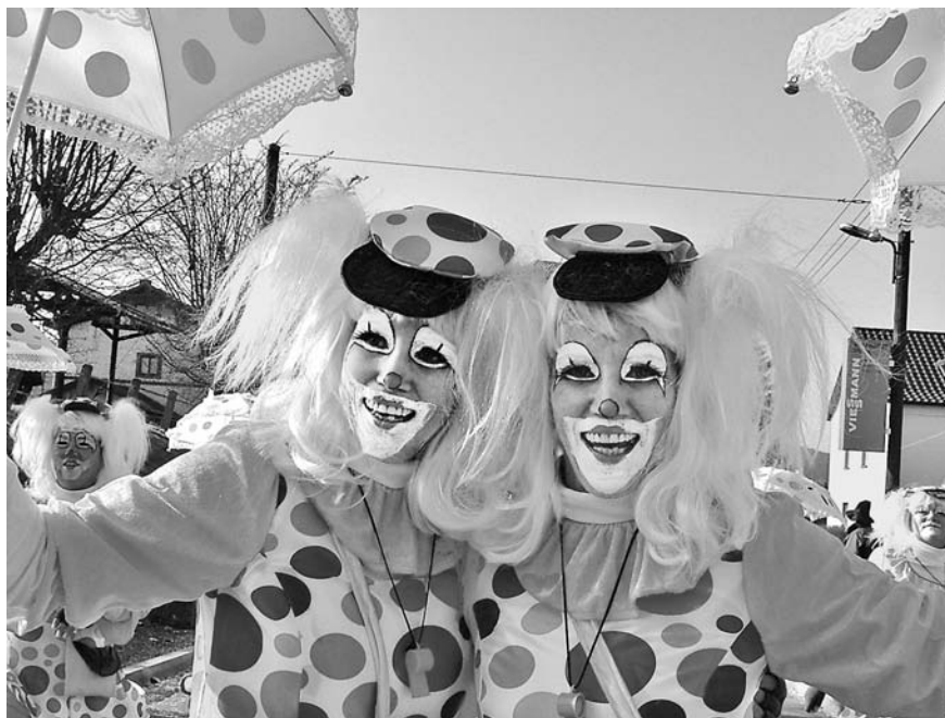
Närrisches Treiben herrscht auch zum 477. Karneval 2012 in Wasungen