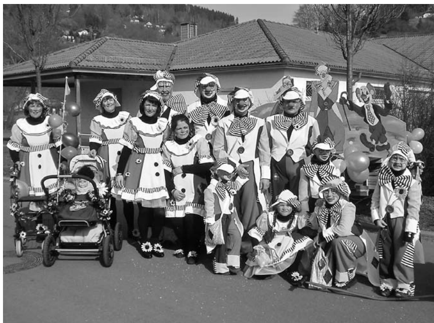
Ob Jung oder Alt – in Wasungen sind alle im Karnevalsieber