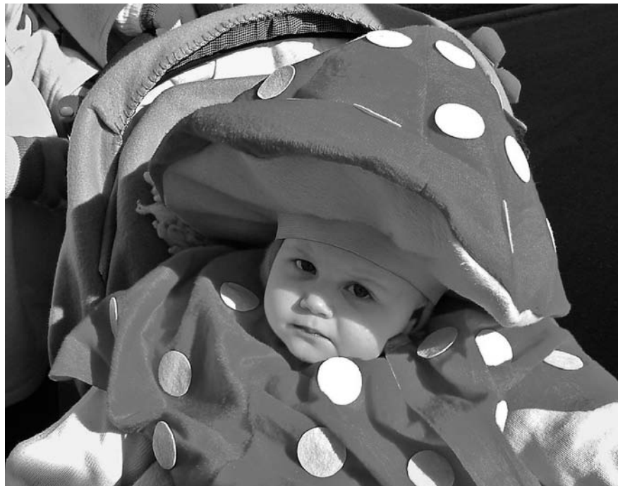
Schon die Kleinsten werden in das umfangreiche Programm einbezogen