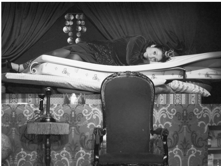
Prinzessin Anna oder Wie man einen Helden findet