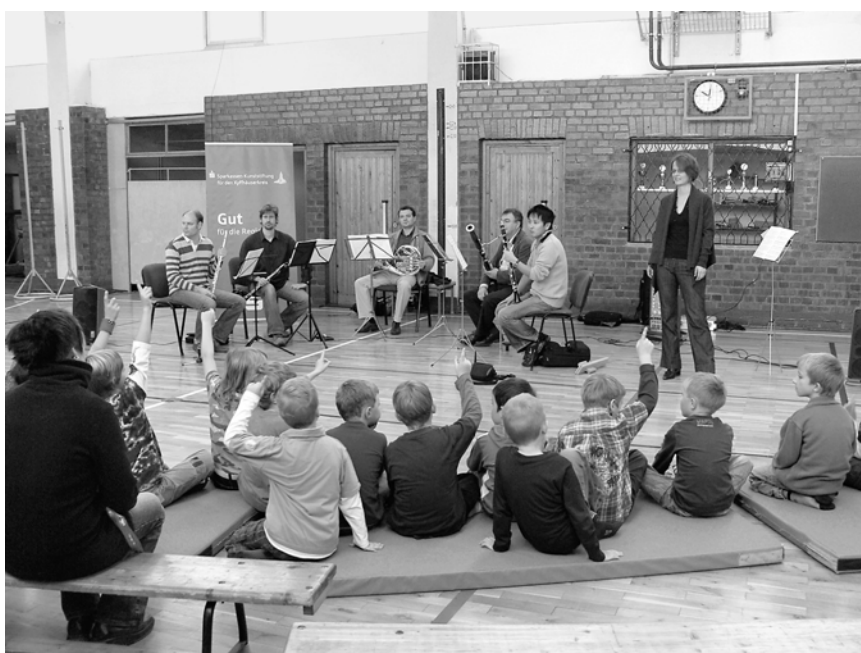
Kammermusik in Schulen