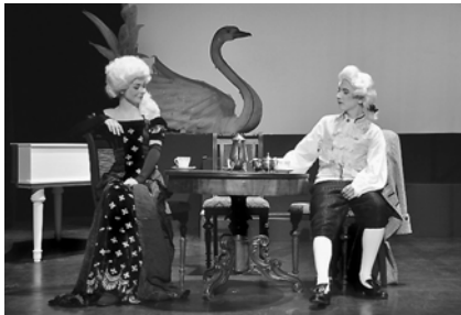
Gefährliche Liebschaften (Theaterjugendclub)

Durch sie bekommen Schulen die Möglichkeit, Theater innerhalb der Unterrichtszeit zu besuchen und es auf eine umfassende Weise kennen zu lernen. Die Werkstatt-Reihe demonstriert anhand einer aktuellen Produktion, wie Theater funktioniert, erklärt Theaterberufe, die Funktion von Bühnentechnik und vieles mehr. Um die Wirkung des Besprochenen direkt zu erfahren, gibt es im zweiten Teil der Werkstatt einen großen Teil der Originalinszenierung zu sehen. Pro Spielzeit zeigt das Theater Nordhausen eine Opernwerkstatt, eine Ballett-Werkstatt und eine Musicalwerkstatt. Zusätzlich gibt es für verschiedene Altersgruppen Orchesterwerkstätten. Für viele Kinder sind diese Konzerte das erste Konzerterlebnis mit einem großen Sinfonieorchester. Hier erfahren sie alles rund um das Orchester. Auch die Musik wird anschaulich erklärt.