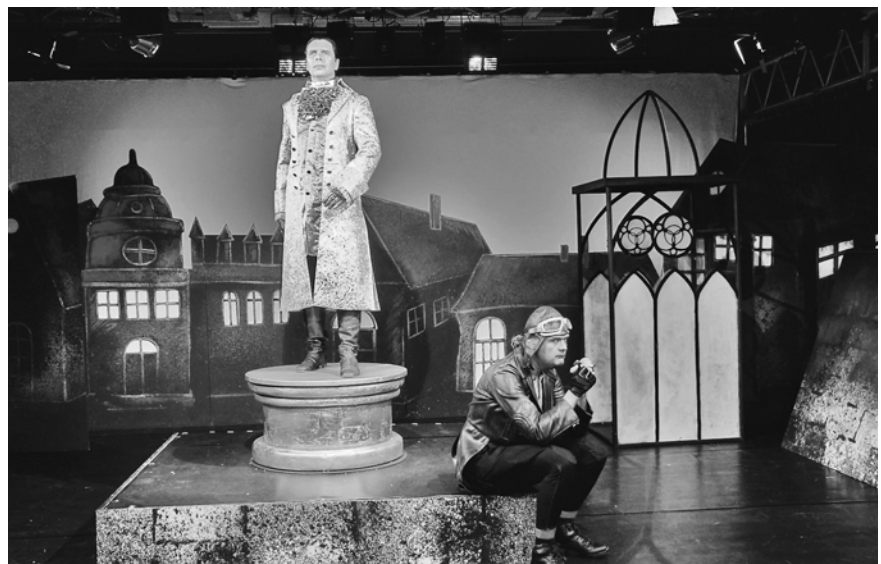
Der glückliche Prinz

schiedliche Stücke auf die Bühne bringen. Im Jugendclub können sich die Jugendlichen unter professioneller Anleitung in den Sparten Schauspiel, Tanz, Musiktheater und Puppenspiel ausprobieren. Bühnenbilder und Kostüme werden in den Werkstätten des Theaters Nordhausen produziert. Beleuchtung, tontechnische