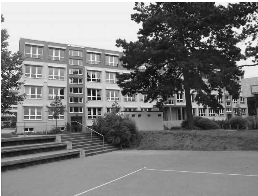
Staatliche Regelschule „Am Kiliansberg“ Meiningen