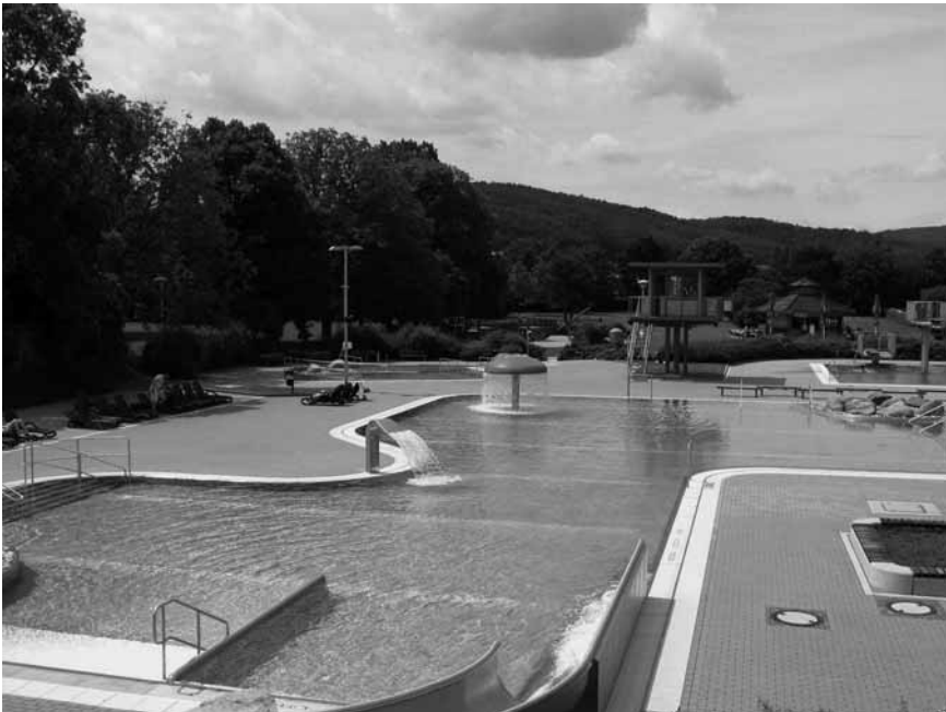
aquaplex – Freibad