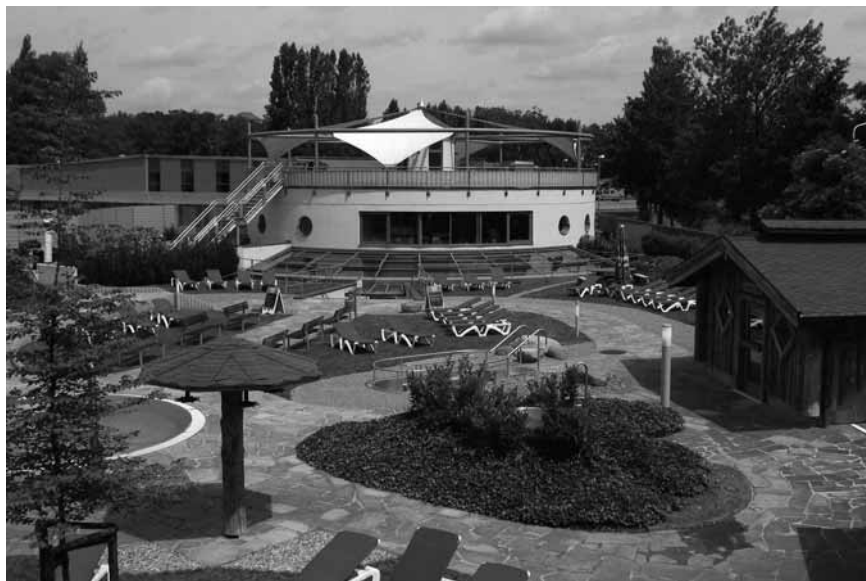
aquaplex – Saunagarten mit Sonnenterrasse