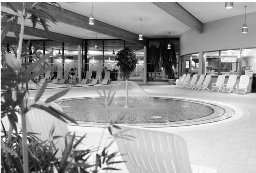
Hallenbad – Planschbecken