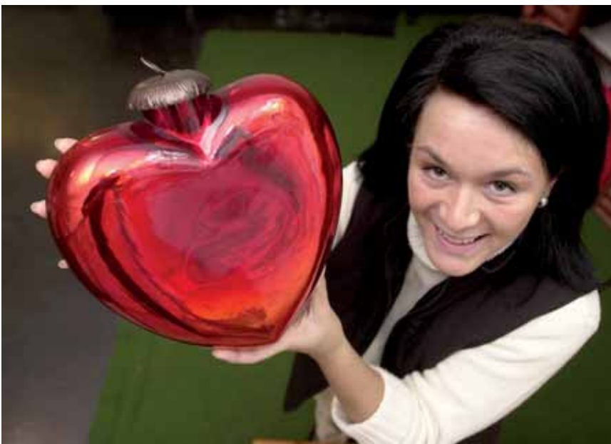
Christbaumschmuck aus Lauscha kommt von Herzen