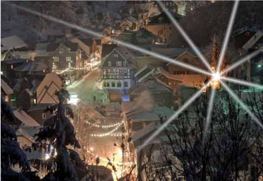
Blick auf den winterlichen Lauschaer Hüttenplatz bei Nacht