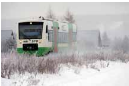
Zum Kugelmarkt kann man auch bequem mit der Südthüringenbahn anreisen

Gisela Husemann Verlag e. Kfr. Wartburgstraße 6, 99817 Eisenach PVSt, Deutsche Post AG, Entgelt bezahlt