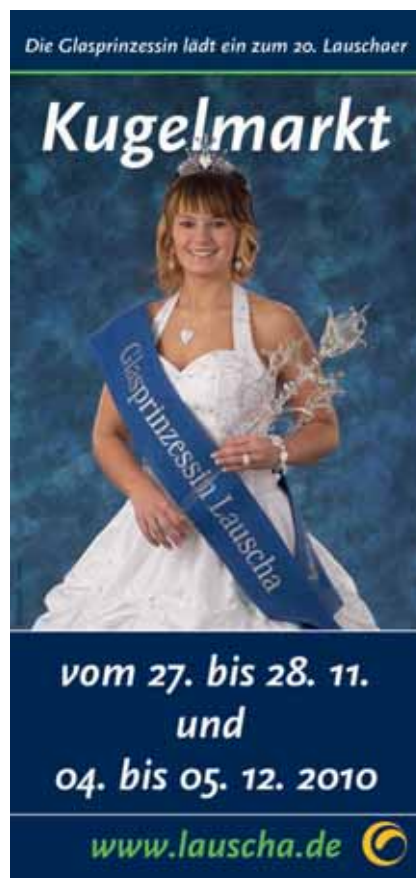
Die Lauschaer Glasprinzessin lädt zum 20. Lauschaer Kugelmarkt

Alle Informationen rund um den traditionellen Lauschaer Kugelmarkt finden Interessierte übrigens im Internet unter www.kugelmarkt.com und www.lauscha.de oder bei der Touristinformation der Stadt Lauscha unter Telefon 036702 22944 sowie per E-Mail unter touristinfo@lauscha.de .