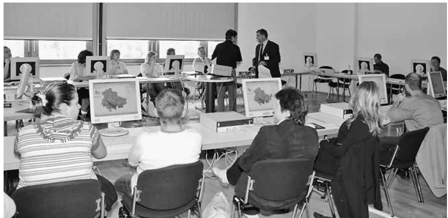
Geoproxy-Workshop auf dem 6. Thüringer GIS-Forum