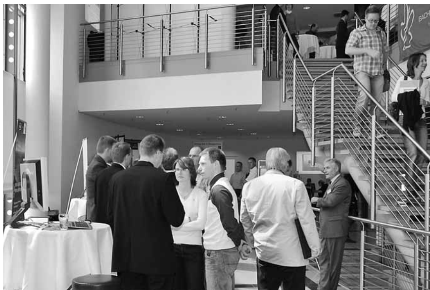
6. Thüringer GIS-Forum 2008

Die Teilnehmer der Veranstaltung sollen über das Potenzial von Geoinformationen informiert werden. Die moderne Informations- und Kommunikationsgesellschaft ist auf diese Informationen angewiesen. Die Anwendungsfelder für diese Informationen finden sich in allen Verwaltungsebenen und Wirtschaftszweigen. Um auf diesem Gebiet erfolgreich arbeiten zu können, benötigt die Geoinformationswirtschaft entsprechende infrastrukturelle Rahmenbedingungen. Mit dem Aufbau einer funktionstüchtigen Geodateninfrastruktur in Thüringen , die u. a. durch die INSPIRE-Initiative eingeleitet wurde, wird nicht nur die Modernisierung der Verwaltung vorangetrieben, sondern auch der Zugang zu den öffentlichen Geoinformationen erleichtert.