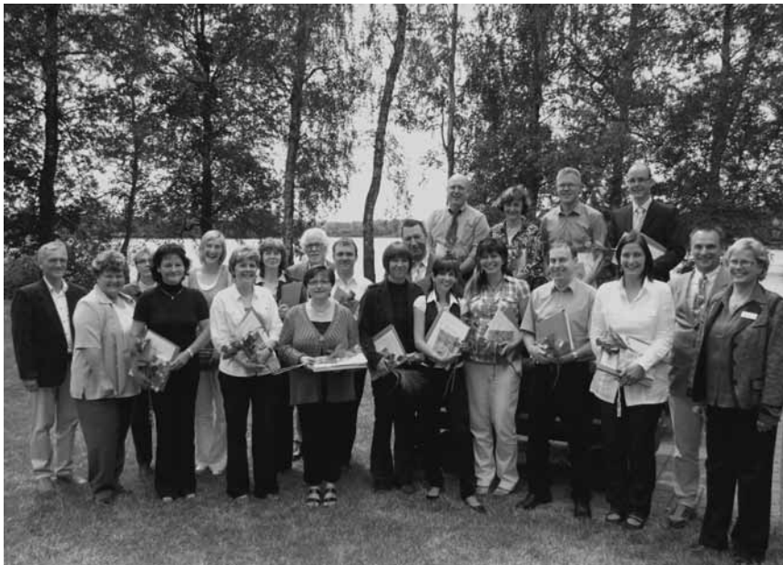
Die „Fit für Führung“-Teilnehmer mit Landrat Frank Roßner nach der Übergabe der Zertifikate