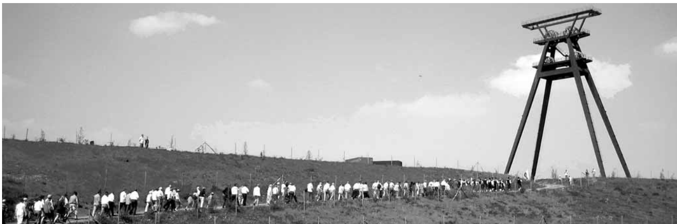
Der Weg zum Förderturm Löbichau