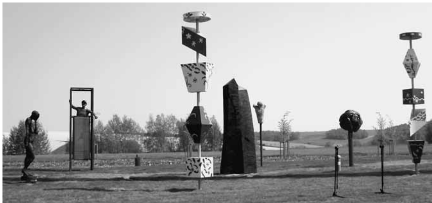
In unmittelbarer Nähe zum Großbild entstand unterhalb des Förderturms ein Skulpturenpark

Aspekten der Kunst und der Poesie. Das offizielle Begleitprojekt des Landkreises Altenburger Land lockte zur Bundesgartenschau in Gera/Ronneburg 2007 mehr als 15 000 Besucher an.