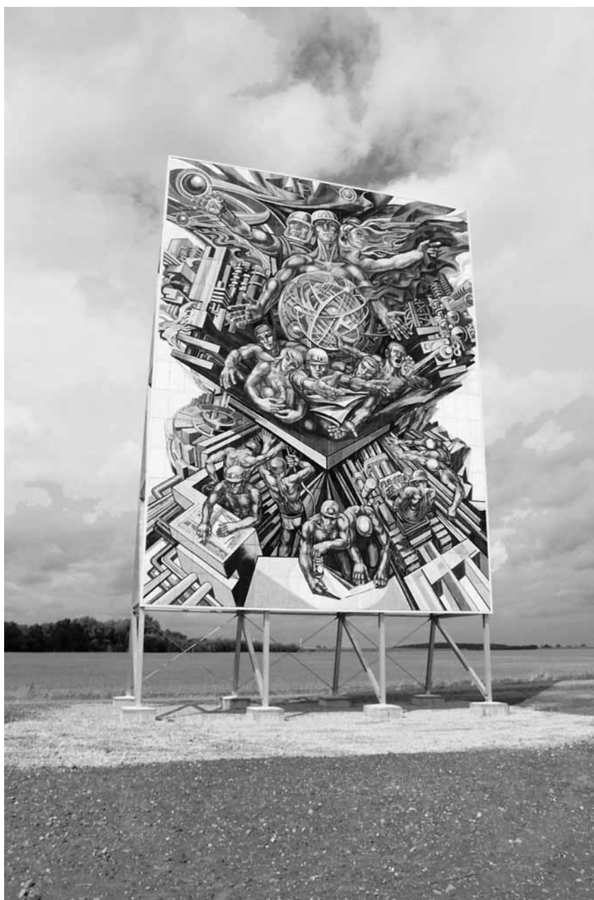
Mit 12 Metern Breite, 16 Metern Höhe und ca. 2,5 Tonnen Gewicht hat das Standbild in der freien Landschaft bei Löbichau schon eine gewaltige Wirkung