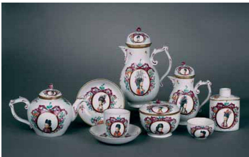
Thüringer Museum – Porzellansammlung – Manufaktur Limbach – Haartrachtenservice – um 1778