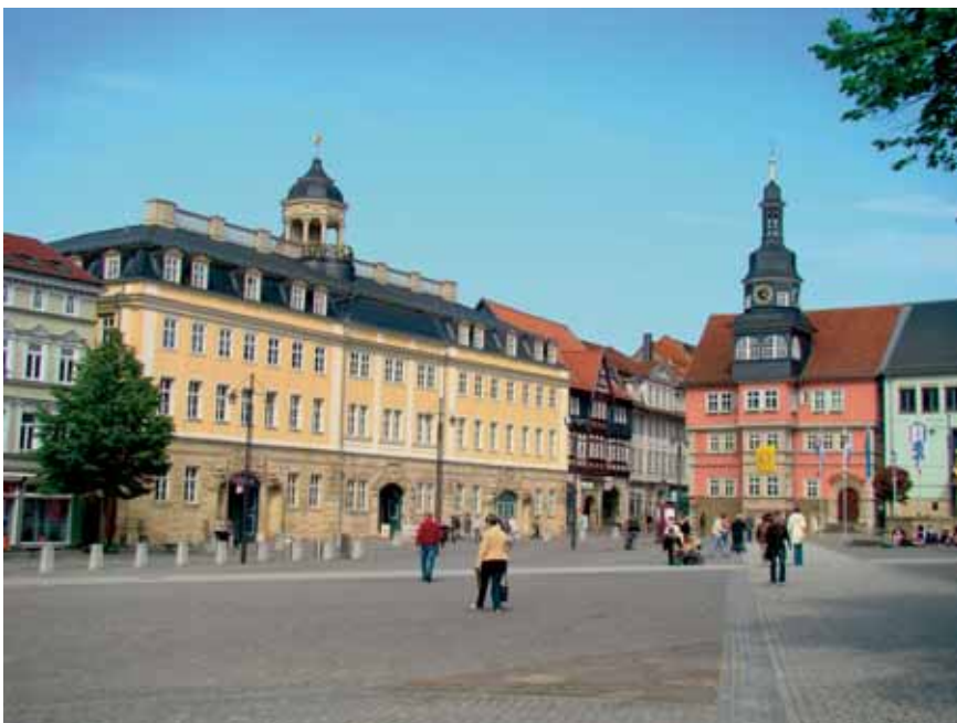
Thüringer Museum – Das Eisenacher Stadtschloss – Marktseite (Südflügel) mit Rathaus