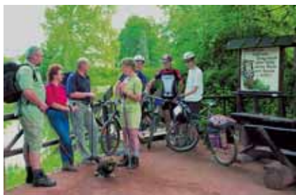
Rennsteigbeginn – Radfahren und Wandern