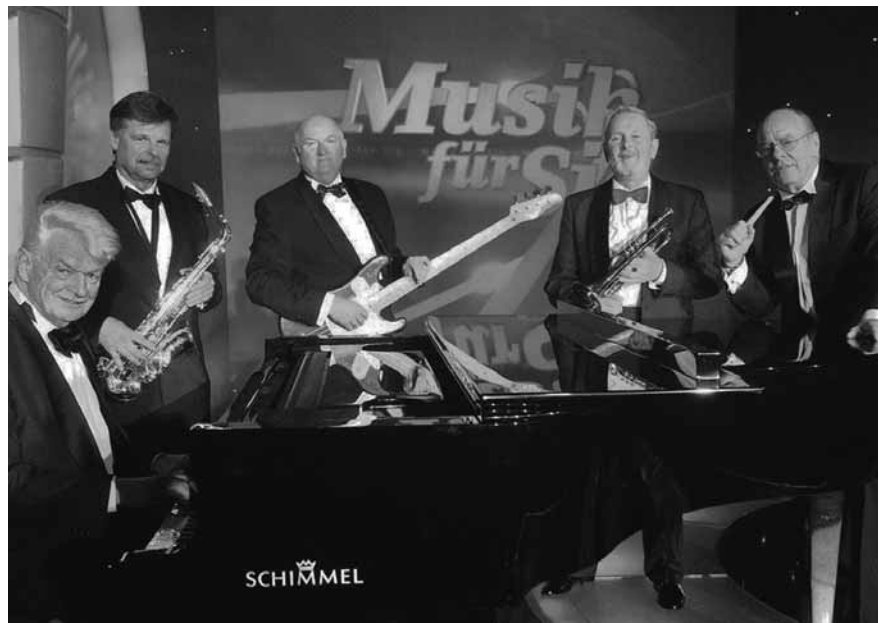
Die Sonneberger Jazz Optimisten