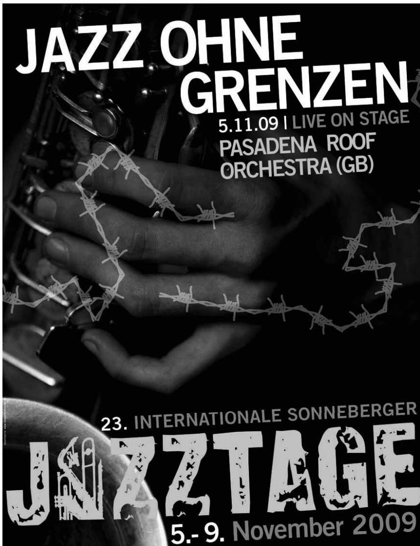
Das Plakat zum diesjährigen Festival