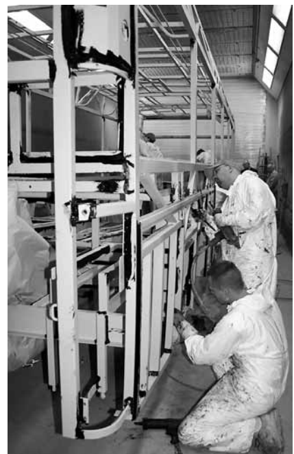
Die NEOPLAN GÖPPEL GmbH in Nobitz-Ehrenhain ist auf den Fahrzeugbau spezialisiert und gehört damit zu den Zukunftsbranchen im Landkreis