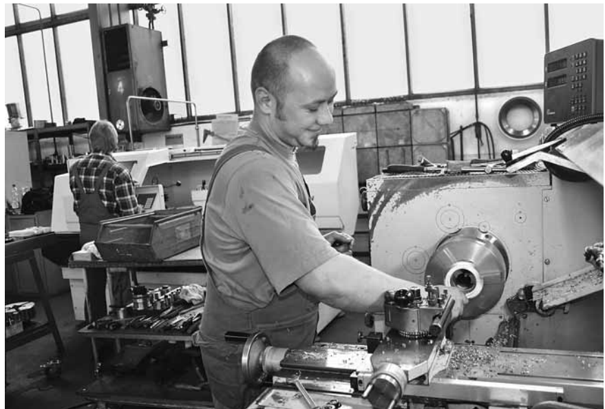
Erfolgreiches Unternehmen der Metallindustrie: Feuma Gastromaschinen GmbH in Gößnitz, hier ein Mitarbeiter in der Produktion

gelesen werden. Dies erhöht die Chancen, die angebotenen Stellen am Ende erfolgreich zu besetzen, was meistens gelingt.