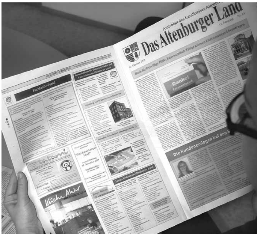
Kostenloser Service des Landratsamtes: Die chiffrierten Stellenanzeigen für Fachkräfte im Amtsblatt