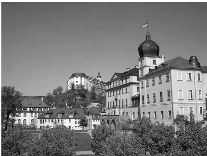
Blick auf das untere und obere Schloss