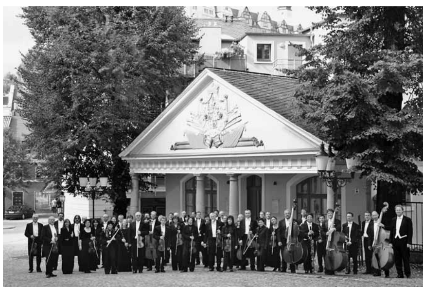
Vogtland Philharmonie Greiz-Reichenbach vor der „Alten Wache“