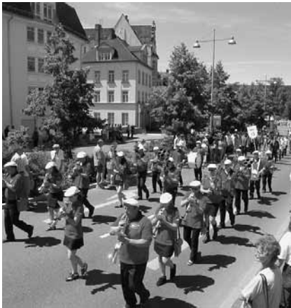
Festumzug zum Park- und Schlossfest