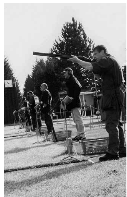
Schießwettkämpfe gehören zu den traditionellen Angeboten des Schützenfestes

Waffensmuseum Suhl Postfach 10 01 64, 98490 Suhl Tel.: 03681 742218, Fax: 03681 742220 E-Mail: info@waffenmuseum.eu