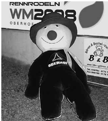
Flocke ist wieder WM-Maskottchen