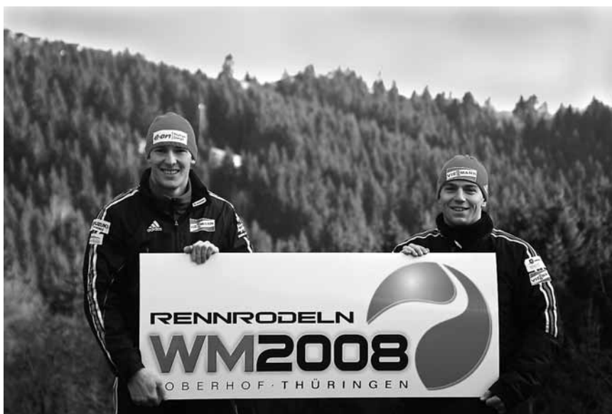
Gelten als WM-Favoriten: Weltmeister David Möller (l.) und Jan Eichhorn

Foto: Anne Huitsch (Wintersport-Förderverein)