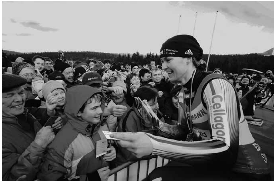
Publikumsliebling Silke Kraushaar-Pielach aus Sonneberg gilt als eine der WM-Favoritinnen

An allen Renntagen wird an der Rennrodelbahn Ice-Rafting (nach den Rennen) angeboten. Die MDR 1 Radio Thüringen Jukebox heizt mit Musik und Mitmachangeboten die Stimmung an. Eine spezielle Rodelbahn für Kinder ist ein weiterer Anziehungspunkt für Familien.