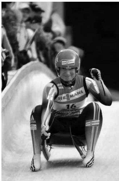
Die deutschen Damen sind seit einem Jahrzehnt unbesiegt

Während der WM wird sich das Gelände rund um die Bahn in eine Eventfläche verwandeln.