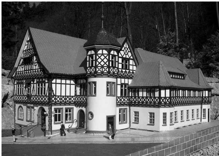
Modell „Alte Post, Bad Liebenstein“