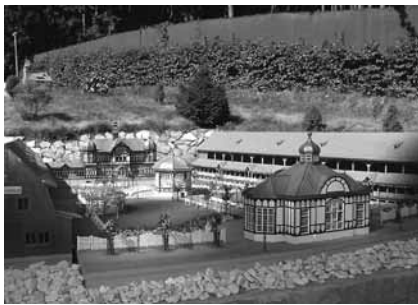
Modell „Gradierwerk, Bad Salzungen“

Das „mini-a-thür“-Gelände besitzt kaskadenförmig angelegte Teiche. Die Modelle sind eingebunden in die herrliche Thüringer Landschaft mit grünen Wiesen, Bächen und Wasserfällen. Die Besonderheit des Parkgeländes steht für die landschaftliche Vielfalt Thüringens.