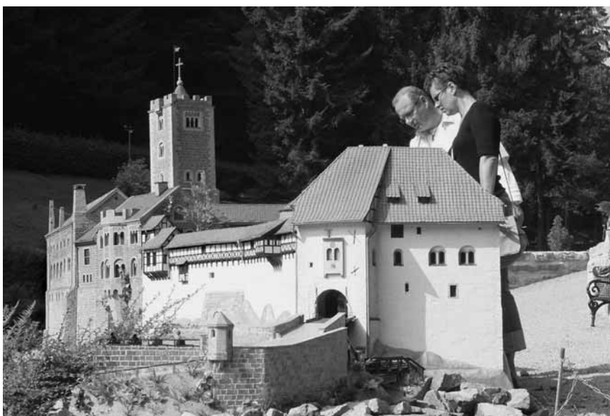
Gäste des „mini-a-thür“ besichtigen das Modell „Wartburg“