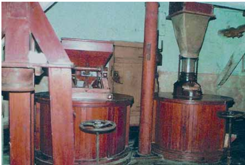
Walzboden im Mühlengebäude

Mühlenfest Herrnmühle Heiligenstadt vom 26. bis 28. Mai 2007 14. Deutscher Mühlentag am 28. Mai 2007