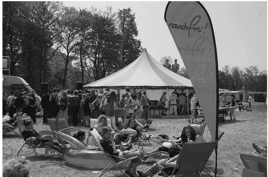
Die Beachlounge „Rauchfrei“ der Bundeszentrale für gesundheitliche Aufklärung wird in Weimar auf dem Markt stehen

Anleitung des ehemaligen mehrfachen Deutschen Meisters Joachim Thumfart den Kreislauf ordentlich in Schwung. Auf dem Theaterplatz besteht u. a. die Möglichkeit, unter den wachsamen Augen von Goethe und Schiller Streetsoccer zu spielen – der beste Beweis dafür, dass sich Sport und Kultur gut miteinander vereinbaren lassen.