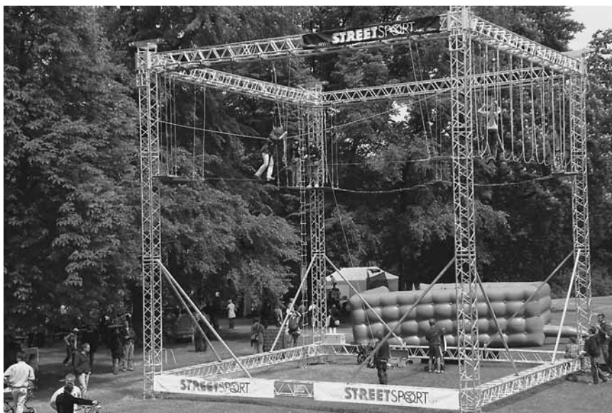
Hochseilgarten am Reithaus im Park an der Ilm