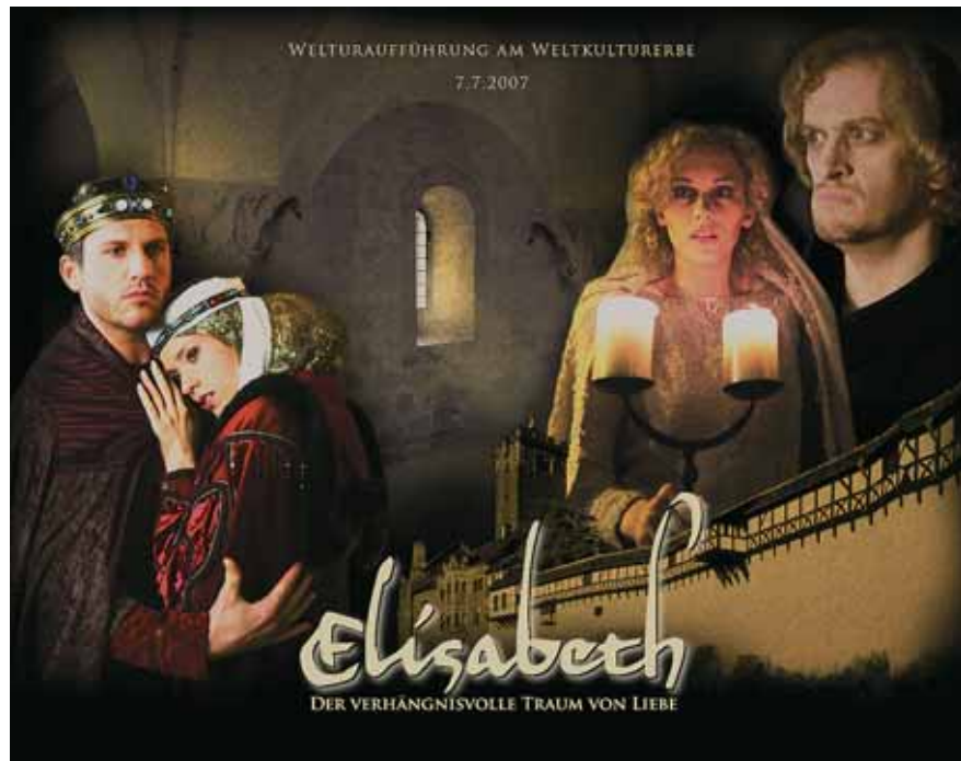
Das Musical „Elisabeth – Der verhängnisvolle Traum von Liebe“ ist vom 7. Juli bis 15. September täglich außer dienstags im Eisenacher Landestheater zu sehen