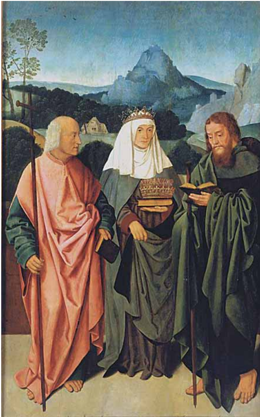
Die Hl. Elisabeth zwischen zwei Aposteln – Gemälde, Öl auf Holz, um 1530 von Bartholomäus Bruyn